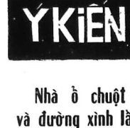
Nhà chuột và đường xính lý

Ngày Thứ Ba 17.3.1966 (Ngày 17 tháng 3 năm Bính-Ng)