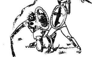
Tranh do vẽ

1) An độn. 2) Lâu Tấn. 3) Một nước nằm trong hai bể Trung Hoa - Vũ của nước 4) Cây thông - Vũ của nước 5) Phàn ghia - Vũ của nước 6) Trường đời. 7) Thập 3. 8) Tân châu từ đất về kinh tầm Đường đời (đường Nam).