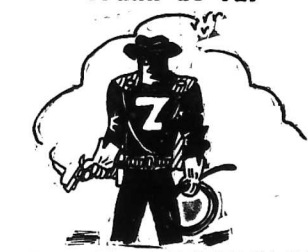
Zorro đang thì triển với tên địch thì lợi hại. Các bạn hãy tìm ra chữ Zorro.