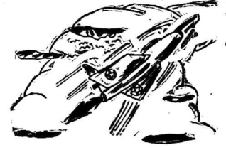
Chức năng của đá vu... (chưa có ai...)