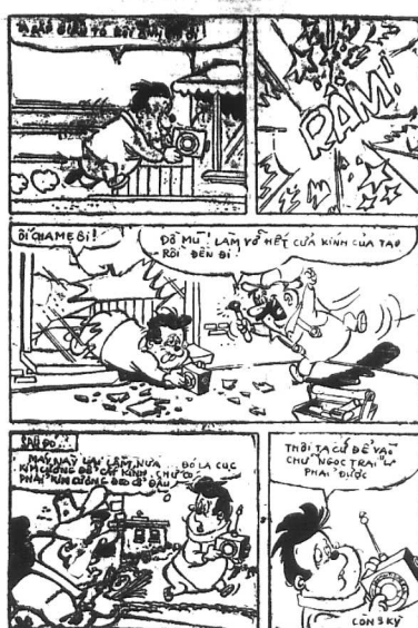
Các em tìm hiểu Phi-Châu huyện bị...