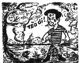
Sau một trận lũ thiên tai đáng sợ, Tê bị nạn. Vào nhà các bạn tìm bị Tê ở đâu?