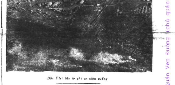
Tại vùng rừng núi Pleiku, địch dụ ra hay ta dụ địch?