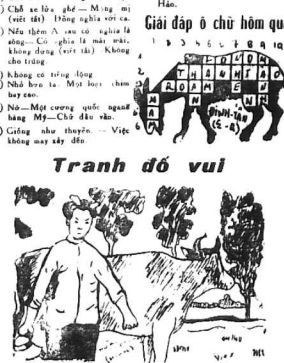
Ông đi tìm bà ở nơi không thấy đâu cả, nhà của ông chỉ là một ngôi nhà...