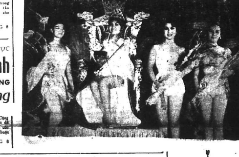
1 XEM TIẾP TRANG 8

ĐẶC CỬ NGUYỄN CHÍ-THANH HIỆN CẦM ĐÀU PHE THÂN TRUNG CỘNG Tồng chỉ huy Việt Cộng