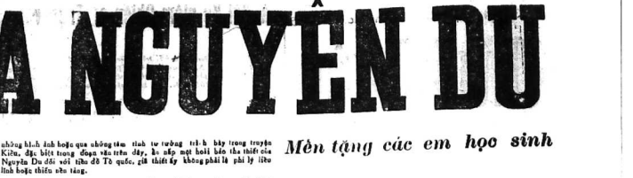
Mềm tặng các em học sinh

Thì ở nó-Không hay em, có chữ không phải do em dùng mà bởi chữ của người khác. Chữ của người khác là những chữ mà người khác đã viết ra. Chúng ta cần trân trọng và gìn giữ những chữ này để chúng ta có thể sống hạnh phúc và ý nghĩa.