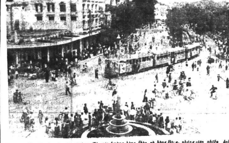
Hà Nội đã chưa bị đời mới. Từ góc đường hàng Đào và Hàng Bạc, phóng viên nhiếp ảnh đã chụp được cảnh như sau...

Hànội như mắc bệnh thần kinh luôn luôn chờ đợi bị tấn công. Nếp sống giống hệt 20 năm trước