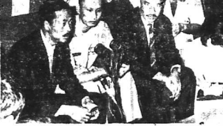
Phi đoàn công du mã lai đã trở về nước. Phong trào kháng chiến tại Tây Tạng. Phả võ cơ sở quân sự của Trung Cộng ở Sikkim.

LAN ĐÈ LẠI 7/10 (UPI). - Người tin không chính thức tại Tây Bắc Việt cho hay đội bay Tây Tạng đang chuẩn bị sẵn sàng để vượt biên sang Ấn Độ.