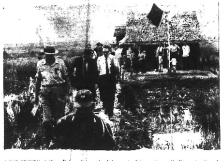
LONG XUYẾN 6.10. - Đại sứ Lodge (ở bên trái) đang nói chuyện với các quan chức địa phương tại Long Xuyên.

Đoàn đại sứ do Đại sứ Lodge dẫn đầu đã đến thăm thành phố Long Xuyên. Trong chuyến thăm này, Đại sứ Lodge đã có cuộc gặp gỡ và nói chuyện với các quan chức địa phương, bao gồm các thành viên của Ủy ban Hòa giải và Ủy ban Cứu trợ. Ông cũng đã thăm các cơ sở y tế và trường học, thể hiện sự quan tâm của chính phủ Mỹ đối với đời sống nhân dân địa phương.