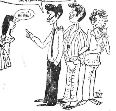
1 - Tên một học sinh... 2 - Tên một học sinh... 3 - Tên một học sinh...

Đã bị một đội quân... đây là một bài thơ... viết về một người... đang cố gắng... đạt được mục tiêu.