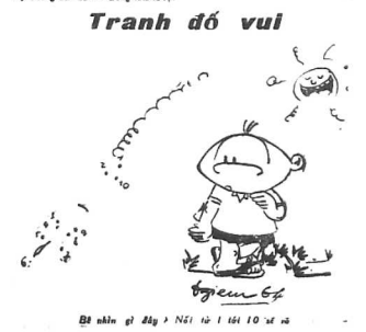
Tranh đồ vui