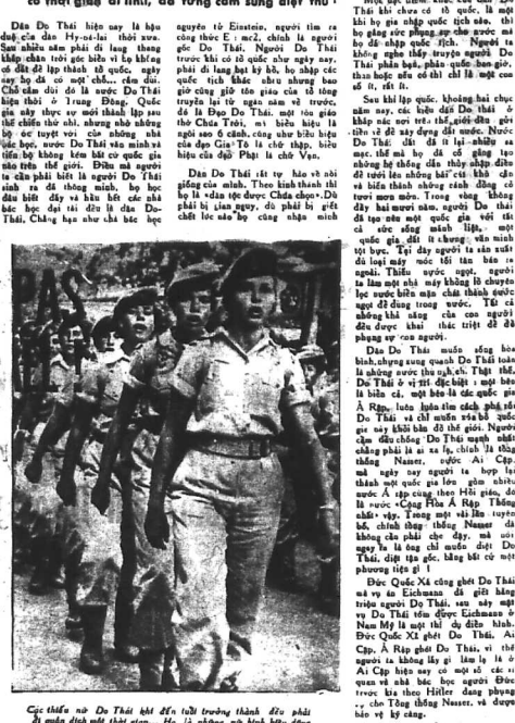
Cực thân... (Còn tiếp)