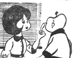
Bộ ba Mai Bê và Bé Tô nhân dịp phát 1 Nương Túc nữ công nhân