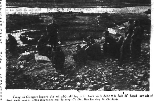
Trang bị Clemente (ngồi ở mặt trái), chỉ huy các binh lực ở vùng này...

(Tiếp theo) - Bút ký chiến tranh của PHAN NGHĨ