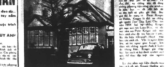
Căn nhà mà các điệp viên Nga Xô đã máy móc chuyển tin đi