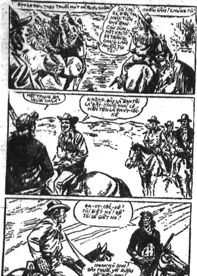
Các em tìm hiểu Phi-Châu huyền bí hay truyện - TÁC GIẢNG CHÚA TÊ RỪNG XANH -

ĐA-VY CỬU BẠN... THỜI THÁI KHÓ... CHỮ TỬ VÂN PI... Các em tìm hiểu Phi-Châu huyền bí hay truyện - TÁC GIẢNG CHÚA TÊ RỪNG XANH -