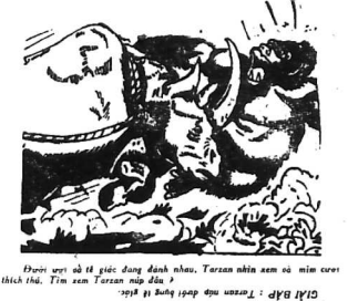
Phản ứng với cái giặc đang đánh nhau. Tarzan nhìn xem ai mới cứu mình thì. Tin xem Tarzan nói đùa...