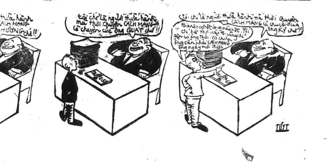
Đó chính là người thừa hưởng... (Caption text describing the cartoon scene)