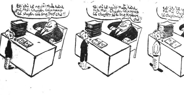
Đó chính là người thừa hưởng... (Caption text describing the cartoon scene)

Những tư tưởng này là những tư tưởng mới mẻ mà nhân dân Việt Nam cần phải có để xây dựng một nước Việt Nam mới. Những tư tưởng này là những tư tưởng mới mẻ mà nhân dân Việt Nam cần phải có để xây dựng một nước Việt Nam mới.