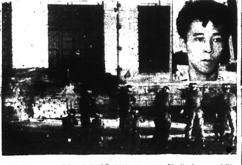
Đẹp nhất người đang thì hành án án. Hình ảnh phiên tòa tại phi trường Tân Hòa Xa.

Thảm họa của THANH THƯỜNG HOÀNG Người của lời tuyên bố của Thủ Tướng Nguyễn Văn Khánh. Chỉ Tích Ủy Ban Hành Pháp Trung Ương (21-6-65) tại làm 10:40 sáng, pháp trường cát tại phi trường Tân Hòa Xa (phần 1) của sân bay Tân Sơn Nhất. Các nhân viên an ninh đang chờ đợi một xe đầy chất nổ.