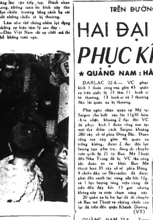
TRÊN ĐƯƠNG BAN MẸ THUỘT ĐĨ NHÀ-TRANG

Đông hồ hay gõ bô với hồ hữu trách nên thấy hiện nên bôn quố đon