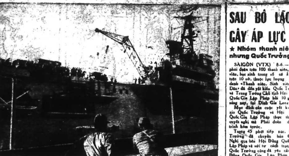
WÔNG TÀU - 400 lính ở Đồ Bỏ... Phần sót của lực lượng chiến đấu ở Đồ Bỏ Lên Vùng - Tàu...