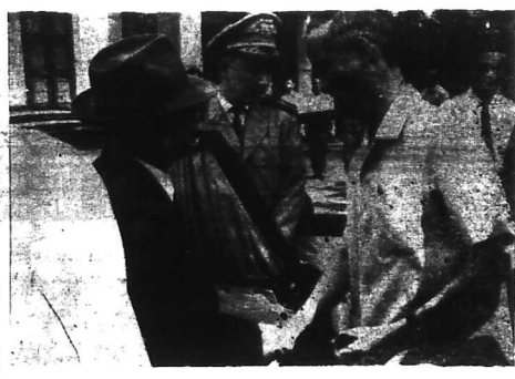
SÀI GÒN - Hôm qua đã có những dấu hiệu cho thấy rằng một khủng hoảng đã được giải quyết dần dần.