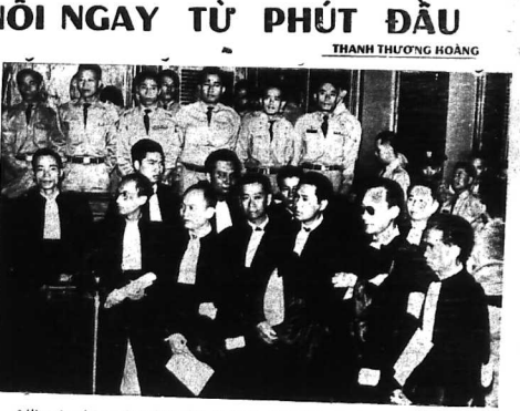
Hàng rào luật sư và các bồi thẩm viên đang nghe phiên tòa.