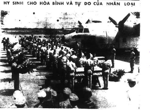
HY SINH CHO HOA BÌNH VÀ TỰ DO CỦA NHÂN LOẠI

HOA THINH ĐÓN - Hôm qua (23) tháng 4, một phi cơ tu mạt tích lực về SAIGON. Nhảy tin tức (21-4) - Kêu gọi các phi công lái máy bay chiến đấu về quê hương.