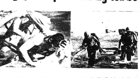
Thủy Quân Lục Chiến chiến công hiển赫