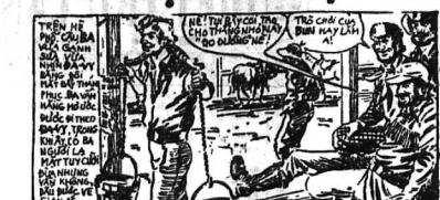
CHỜ ĐỢI... CHỜ ĐỢI... CHỜ ĐỢI...