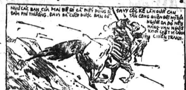
ĐA VỸ CỐC KÊ LÊN ĐƯỜNG CÁN... MẮT TRỘM... ĐÁI CHẾ...