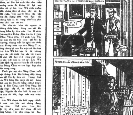
Hiệp sĩ Biech Du trở lại thăm từ