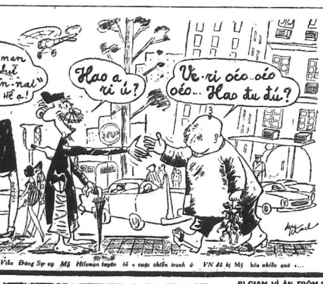
Nhân viên Trường Văn Đoàn Sĩ học Mỹ Hilton tuyên bố về cuộc chiến tranh và VN để hòa bình quốc...

Đông Đức Công bố một tuyên ngôn về sinh đân giới mới.