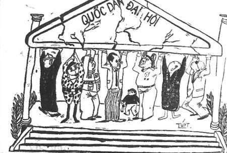
ĐẠI SỨ TAY

TRÒ CỜ ĐIỂM MÀM VÀ ĐÁNH KHÁCH. TRÒ CỜ ĐIỂM MÀM VÀ ĐÁNH KHÁCH. TRÒ CỜ ĐIỂM MÀM VÀ ĐÁNH KHÁCH.