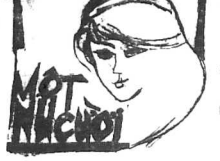
Tiểu thuyết rất ngắn của một nữ sĩ... HỒNG-DƯƠNG