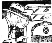
em; vậy từ đây, em được học chi chi báo cho em...