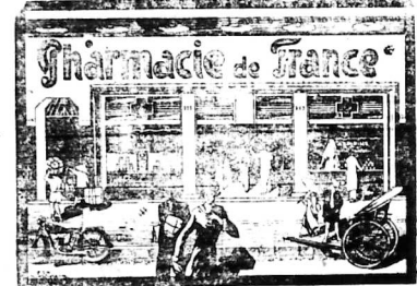
Nhà thuốc riêng loà hết và kim thời hơn hết trong các Đông Pháp Công cuộc mà hàng cấp bậc k. có loại thanh ra một nhà thuốc đưa vào hàng nhất trong các đại dược phòng.

Pháp-Quốc Đại-Dược Phòng 111-1'8, đường Catinat - Saigon