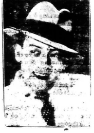
CO PÁY NÁN M. CHAU