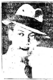
NG. B. NAM