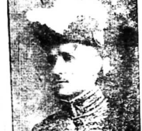
Quan Thông-Độc Pagès

Thưa quan Thông-Độc. Thưa quý bà, quý ông. Ngày nay là ngày khai-mạc lễ Canh-nông của Nam-kỳ, tôi xin thay mặt của Ban-trị-vụ lễ này mục đích và ý nghĩa của lễ này là gì. Lễ Canh-nông mới khởi sự ở đây đầu tiên ở Saigon, có người tưởng là lễ mới bắt đầu ra, chờ kỳ trung lễ mới cuộc lễ của chúng ta để làm khấn-trong sự từ-xưng đân-nghĩa, nhưng lập riêng, chủ tịch bản lễ ha-diên, chủ tịch bằng lễ Thán-Ngã v.v. là vì nơi này khác nhau, chỉ không có một lễ hiệp chung như ngày nay để thôi.