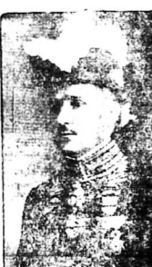
Quan Thống-Hốc Nam-Ky

Theo tin tức các báo quân Tàu... Turloc dự tin lại đây, người NHƯT đã thực hành thành-sạch... Năm Giáp-nhọ, năm khỉ, chiến-thắng nhà Thanh, nước NHƯT... Ai cũng biết rằng nước NHƯT... Bất dưng đem quân vây-hãm Tàu... Giới tiếp trường 6