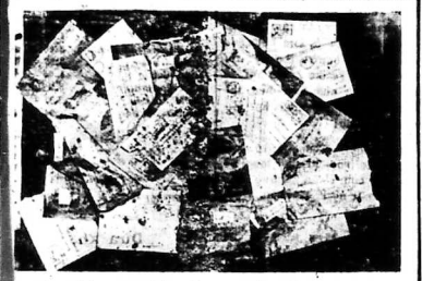
Một cái bồng có thợ khéo vẽ ngọc phiến giới đầu Quận - Chua mới ngày xưa có làm. Vậy ông qui và các nữ đều hơng nghành như Quận - Chua 21. Amiral courbet Saigon - Trưng này làm như...