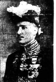
Quan Thống-độc Pháp

MUÔN BIẾT CHẮC TÌNH HÌNH HƯ HẠI VI NẠN THỦY LỤT Quan Thống - đốc ĐI LONGXUYỀN-CHAUĐỐC 120 ngàn mẫu ruộng bị ngâm nước Quan Thống-độc định xuất ngay 10 ngàn đồng để chẩn-tê