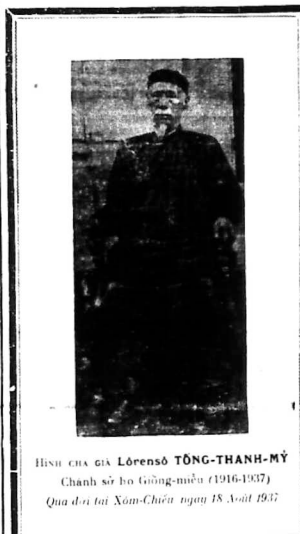
HÌNH CHA GIA LÔRENSÔ TỔNG-THANH-MỸ

Đám tang vừa tiếp đặng bài-lai-của của vị Đức-quá L. T. T. V. giờ đến xin dâng vào báo L. T. Dầu việc đã qua, song muốn vừa lòng người xin, nên đem báo đăng ý bài ấy, như sau đây: