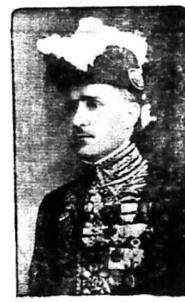
Quan Thống-Độc Pagès

Đời tôi con đường thứ nhất, từ ngày Novembre 1931. Hội-dồng Quản hạt và Hội đồng địa - hạt đều nhau hợp sức tạo nên, mặt đầu đường trải qua thời kỳ kinh tế khủng-hoàng, và đã tốn những 300.000 đồng. Đạp được nó nhà cấp quyền và dân sự đã phải hao công của đất nhiều, và cũng cũng tốn của những tay chuyên môn và lòng tốt-sáng của người hào sảng ngày nay mới được kết quả tốt đẹp như thế.