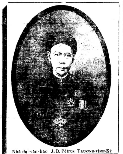
Nhà đại-văn-hào J. B. Pétrus Trương-Vinh-Ký