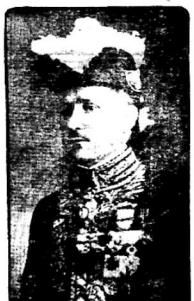
Quan Thông-Độc Pagès