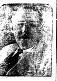
Quan Thông-đọc CHATEL

Paris 18 Mai. - Ở cả những phương pháp của những kẻ lừa huơng đi xe không mua vé, từ đây nên biến thiên phương pháp mới này.