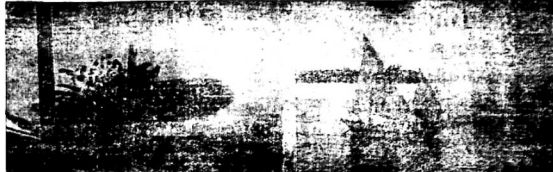
Cả học sinh và giáo viên đang tham dự buổi họp.