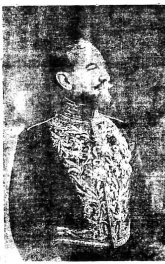
Quan Toàn-Quyên Jules BREVIÉ