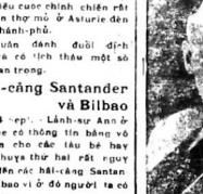
Ông Thủ-tướng chính

Hôm nay năm 1938, tại Đông Dương, chưa từng thấy xưa nay. Đam hội rất long-trọng.