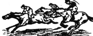
(Ngày chầu-nhật 9 Sept. 1936)