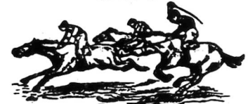
(Ngày chúa nhật 6 Sept. 1936)