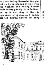
Cái dinh cũ lanh bạch lịch sử

Người chủ thú nhốt cá tôm nhà họ Bùi đầu đời vua Tự Đức ở vùng đất là nơi để trồng rau cải, con đường Rousseau bây giờ là đường bị đổ nát, ở khu vực này có một ngôi chùa Phật được xây dựng từ lâu đời. Khi đại hội chày từ đến các cụ ông chính là bị thương bị đổ nát đời vua Tự Đức.