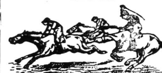
KỶ THỨ HAI MƯỜI (Ngày chầu-nhựt 29 Mars 1936)