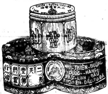
式圖面包壹瑞玻大

Dầu Cà-lô mới TÊN LÁ: PHÁT-LINH-ĐẦU hay là ĐÀU BÙ-ĐÀ Hạt nhân chất 0510 Thế mạng chất 020