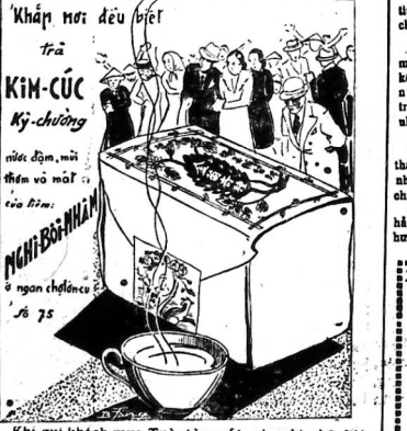
Khởi khách mua Trà tầu rất xin nhìn kỹ hiệu Nghi-Bôi-Nhiệm có nhân xe tầu.