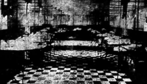
Cảnh quang phòng thí nghiệm tại Adrian Pelt, một tinh thành Vinhlong rất khang-khởi... HỘI CHỢ Ở BÀI LAO...